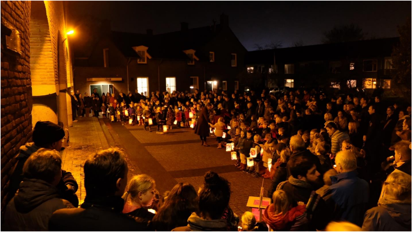
Sint Maartensoptocht afgelopen maandag. Wat een mooie tocht met al die lichtjes en al die mensen!