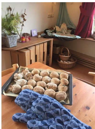
Broodjes bakken met peuters.

Wilt u eventuele belangstellenden voor BSO/Peuterhuis attenderen op deze Open Dagen?!