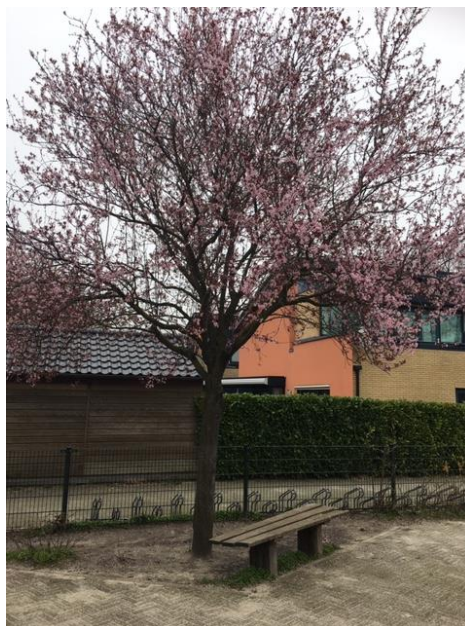
De boom op het grote plein kent geen Corona-crisis en komt volop in bloei! De lente begint...