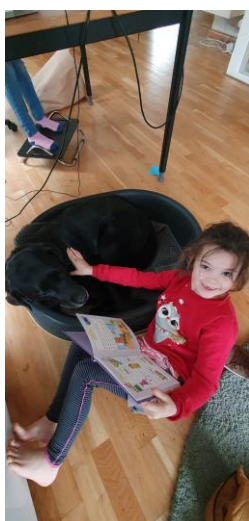
Lezen met de hond