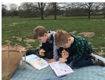
Lezen in het park