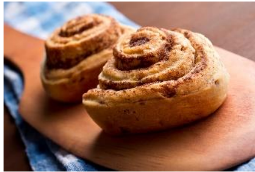
Groetjes aan alle kinderen van de kleuterjuffen

Stap 6: Zet de rolletjes 15 min. in de oven, even laten afkoelen en.....smullen maar!