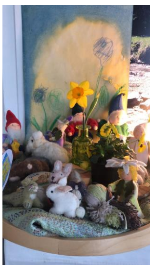
Mooie lente tafel maken.