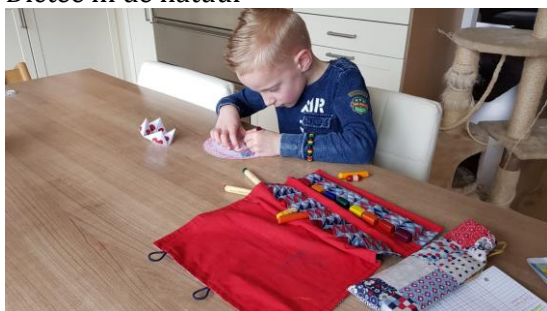
Voorkant voor schrift maken en ziet u het happetjes met sommen die samen 10 zijn.