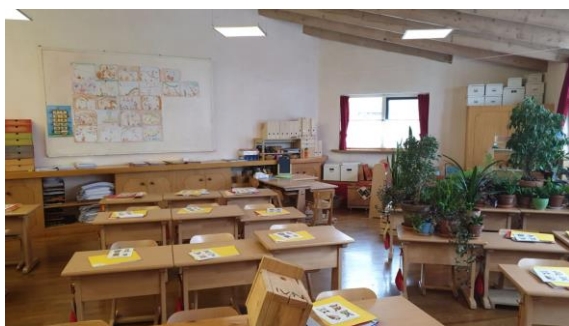
Een lege klas