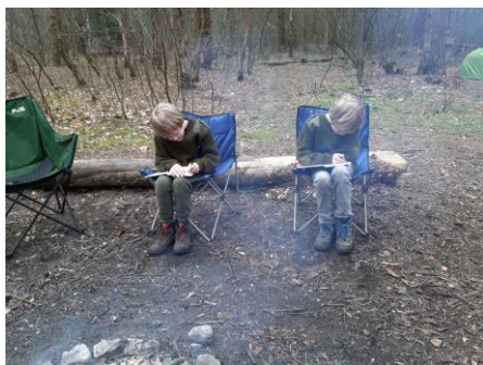
Dictee in de natuur