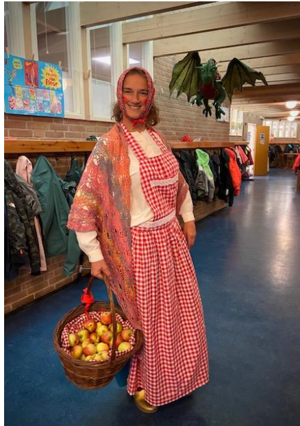
Het appelvrouwtje kwam lekkere appels uitdelen tijdens het Michaelsfeest