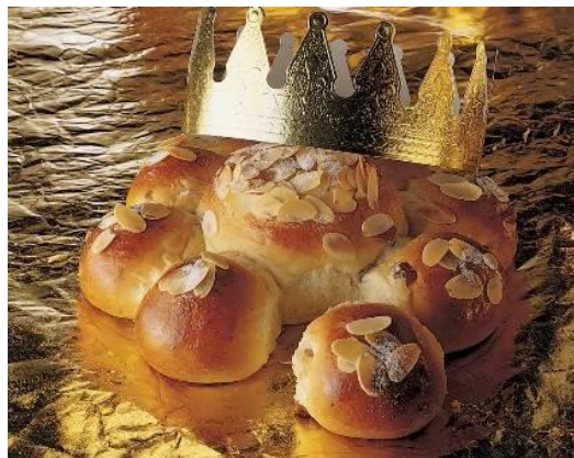
Lekker smullen maar!

Zeef de bloem met het zout boven een kom en meng er de suiker en de geraspte citroenschil door. Verwarm de melk lauwwarm en los de gist op in de lauwe melk. Smelt de boter in een pannetje en laat afkoelen. Maak een kuiltje in de bloem en doe hier de gistoplossing, de gesmolten boter en de eierdooiers in. Kneed alles met koele hand tot een mooi soepel deeg. Laat het deeg, afgedekt met een vochtige doek, 1 uur op een warm plekje rijzen. Kneed dan de amandelspijs door het deeg, verdeel het deeg in bollen. Stop in drie bollen een boon. Maak er een "breekbrood" van door alle bolletjes tegen elkaar aan te drukken. Beboter een bakplaat, leg het breekbrood erop en strooi er wat bloem over. Laat de bol, afgedekt met een vochtige doek, nog eens 45 minuten op een warm plekje rijzen. Bak daarna het brood iets onder het midden in een voorverwarmde oven op 225 graden in 45 minuten goudbruin en gaar. Smelt intussen wat boter in een pannetje en laat afkoelen. Laat het brood op een rooster uitdampen en bestrijk de bovenkant met de gesmolten, afgekoelde boter en strooi er amandelschaafsel over. Voor het opdienen kun je er wat poedersuiker overheen strooien. Wie zou de boon vinden? Wie mogen dit jaar de koningen zijn?