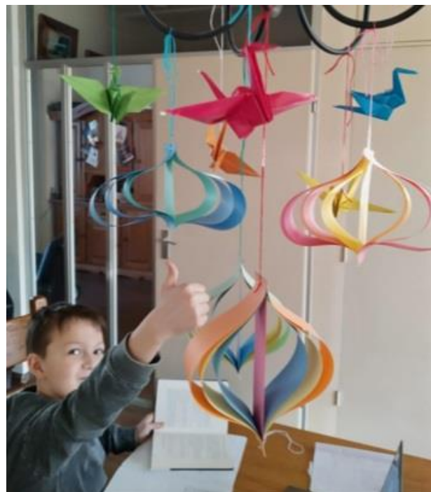
Niko heeft een aantal kraanvogels gevouwen