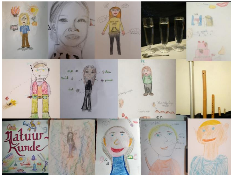
Collage zintuigen natuurkunde