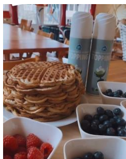
Deze week zijn er heeeeeerlijke wafels gemaakt op de BSO

Op afspraak is het mogelijk om eens een kijkje te komen nemen.