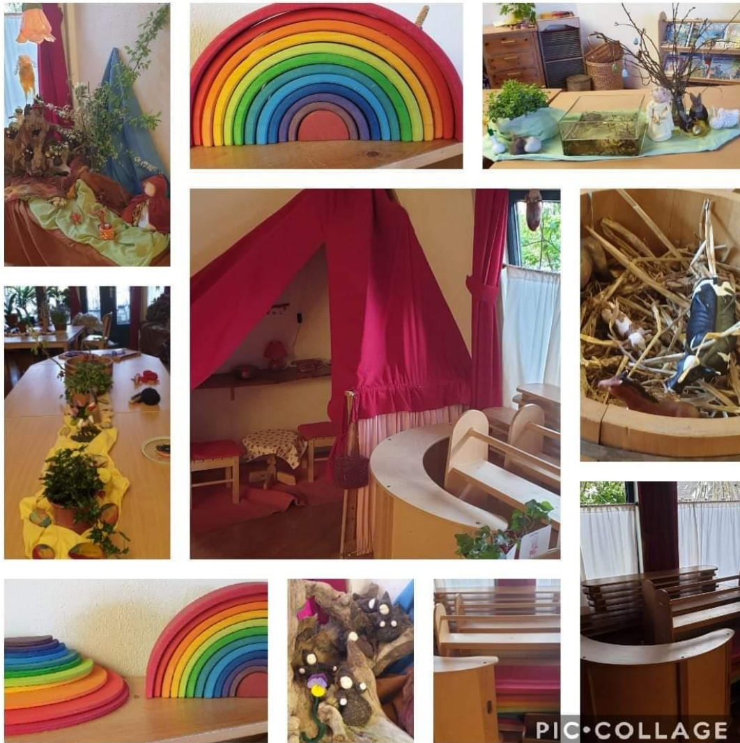
Fotocollage van de kleuterklassen