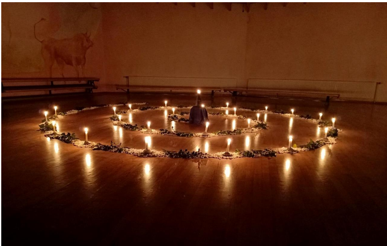
Adventstuin in de zaal

In de tweede adventsweek lopen bijna alle klassen de adventstuin in school.