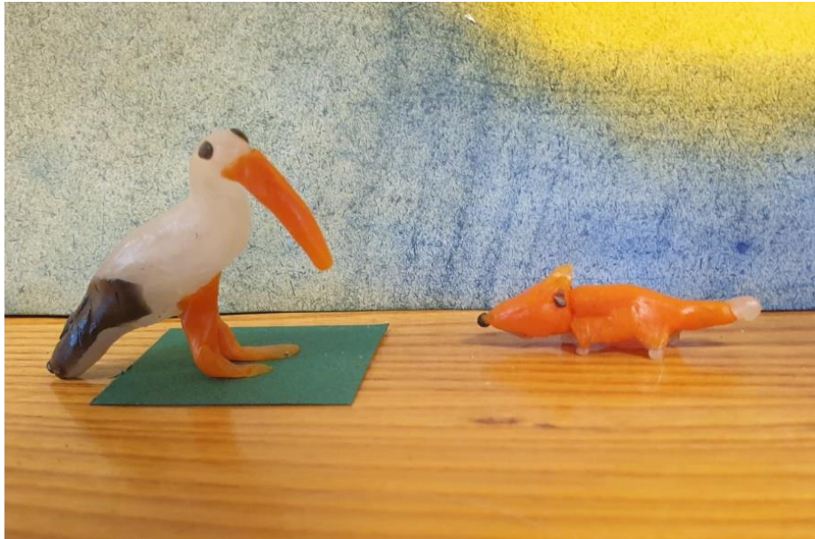
Klas 2: Fabel, de vos en de ooievaar

Daarnaast worden er uiteraard ook eigentijdse verhalen uit diverse culturen verteld in alle klassen, maar ook wekelijks tijdens de weekopening en tijdens het voorlezen.